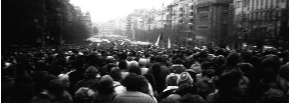
Wenzelsplatz in Prag.