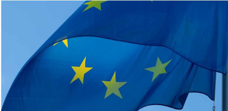
Flagge der EU.