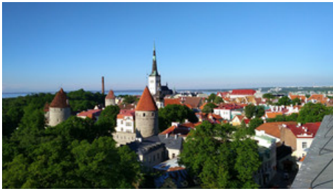
The Baltic Times (eng)