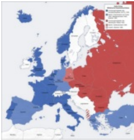
Ehemalige Ostblockstaaten (in Rot).

Die Aufteilung Europas in einen demokratischen und einen sozialistischen Block nach dem Zweiten Weltkrieg relativierte die Grenzen zwischen den Regionen Mitteleuropa, Südosteuropa und Nordosteuropa ohnehin. Die Zugehörigkeit zum politischen Block im Ost-West-Konflikt bestimmte den Verlauf der Grenze zwischen Ost- und Westeuropa, wobei die tatsächliche geographische Lage einzelner Staaten, z.B. der DDR, Griechenlands oder der europäischen Türkei, dieser politisch motivierten Zuordnung widersprach. Prag gehörte zum Ostblock, während Wien, das weiter im Osten liegt, dem "Westen" zuzuordnen war. Erst mit dem Ende des Ost-West-Konflikts wurde diese Aufteilung in Ost und West wieder aufgehoben. Differenziertere Bezeichnungen wie Ostmitteleuropa oder Südosteuropa sind heute wieder aktuell.