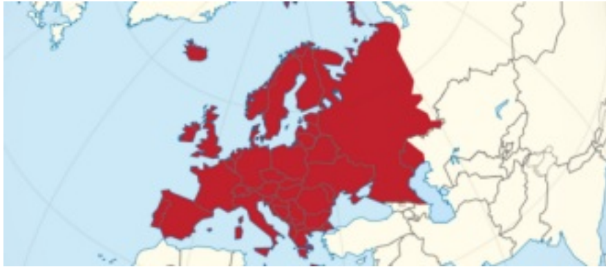
Satellitenkarte von Europa.